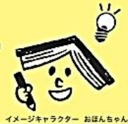
イメージキャラクター おほんちゃん

「読書感想文をどうやって書いたらいいかわからない」 「どんな本を読んだらいいかわからない」 そんな声にお答えします。 さあ、読書感想文にチャレンジしよう!